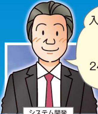
システム開発 御担当者様

(※1) サービス付き高齢者向け住宅とは、マンションの ように独立した住居で暮らすことができ、安否確認 や生活相談などを受けられる住宅のことです。