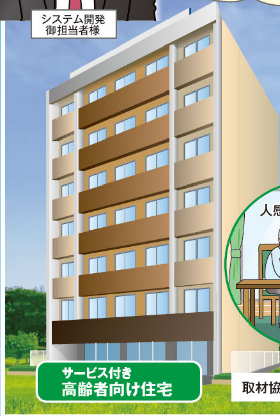
サービス付き 高齢者向け住宅