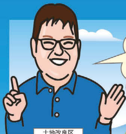
土地改良区 御担当者様